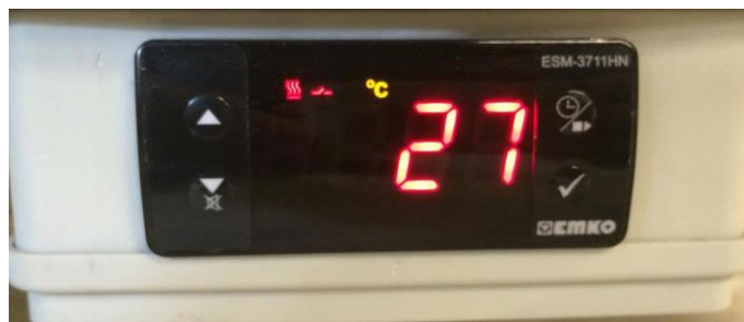
Joonis 4. Temperatuuri kontrolleri sisselülitatult

Kontrolleri sisse lülitades ilmuvad ekraanile numbrid, mis näitavad hetkel saavutatud temperatuuri: