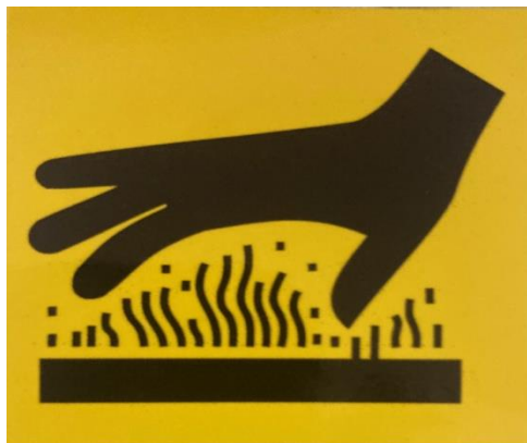
Kuum pind / põletus oht !