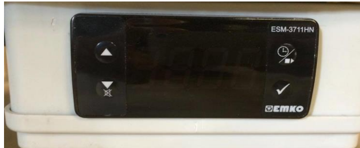
Joonis 3. Temperatuuri kontrolleri väljalülitatult

Kui temperatuuri kontrolleri ei ole sisselülitatud, siis ei põle ega vilgu ühtegi tuld: