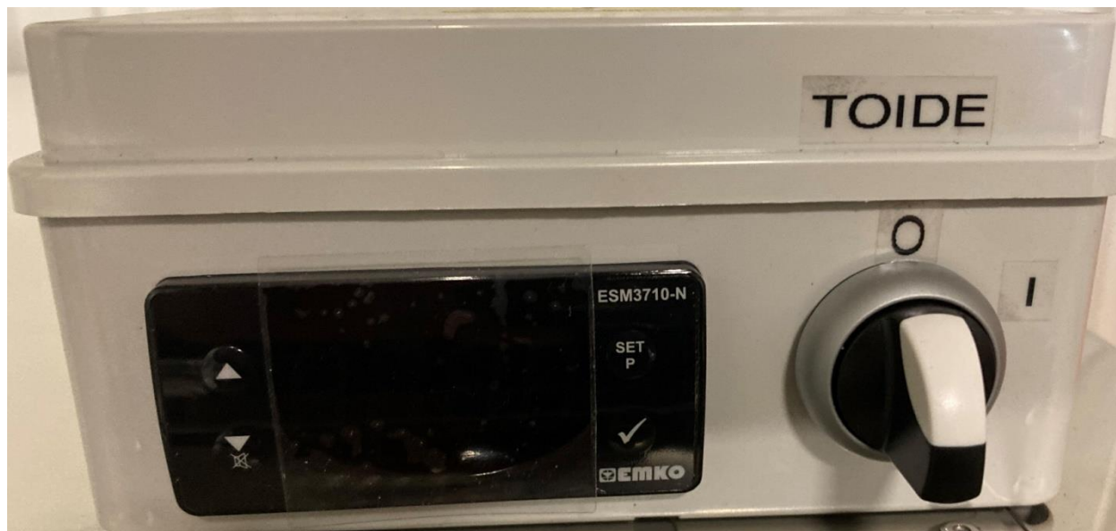
Mee soojenduskapi mini juhtpult.

Pöörata kilbil nuppu “ TOIDE ” asendisse “ I ”. Välja lülitamiseks asend “ O ”. Seejärel läheb tööle temp. kontrolleri tabloo. Seadistada soovitud temperatuur seadmes.