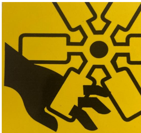
Pöörlev tiivik / vahelejäämise oht