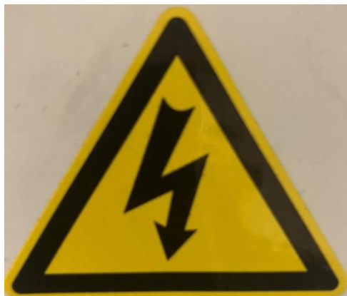
Elektrioht / elektriosad

Elektrioht / elektriosad – märk viitab juhtpuldile mis sisaldab arvestataval hulgal elektroonikat. Igasugune juhtkilbi lahti tegemine / monteerimine ajal mil seade on vooluvõrgus on rangelt keelatud!